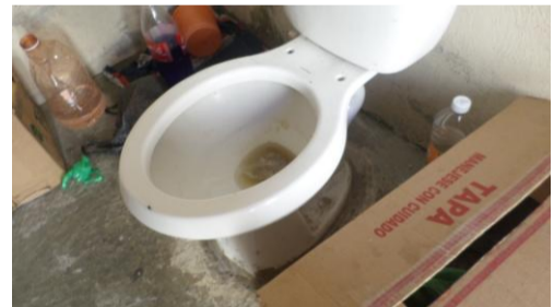
Sanitario obstruido – dormitorio varonil