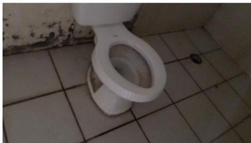
Sanitario dormitorio femenil