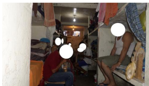
Espacio ocupado por 60 internos psiquiátricos

Es necesario crear instalaciones que reúnan las condiciones que garanticen una estancia digna a los internos con padecimientos mentales que se encuentren bajo su custodia, así como de realizar las acciones necesarias para mantenerlas en buenas condiciones, en cuanto a su infraestructura, muebles y servicios. Para lograrlo, las autoridades deben