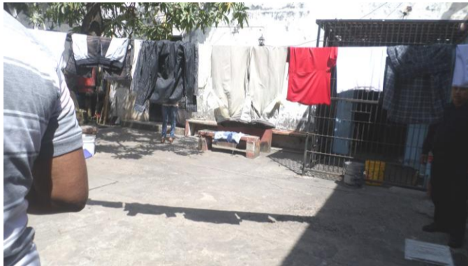
Los elementos de seguridad (hombre) responsable de la vigilancia del área femenil.

Cabe mencionar que aún cuando la libertad de deambular se ha visto restringida por la naturaleza de la medida preventiva impuesta o por la sentencia condenatoria recaída, en sí, no se suspende el derecho genérico a la libertad con todas sus modalidades, es decir, pervive para la interna el derecho a la libertad de pensamiento, de creencia, a la asociación y reunión pacífica, y sobre todo al libre desarrollo de su personalidad, para lo cual requiere del llevar a cabo actividades físicas, culturales y educativas, negadas tácitamente dadas las condiciones en las cuales permanecen.