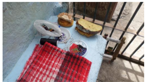
Material de trabajo, aportado por el familiar

(Trabajos a base de hilo, rafia y chaquira, ingreso semanal aproximado de 30 pesos).